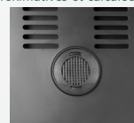
FILTRE AU CHARBON